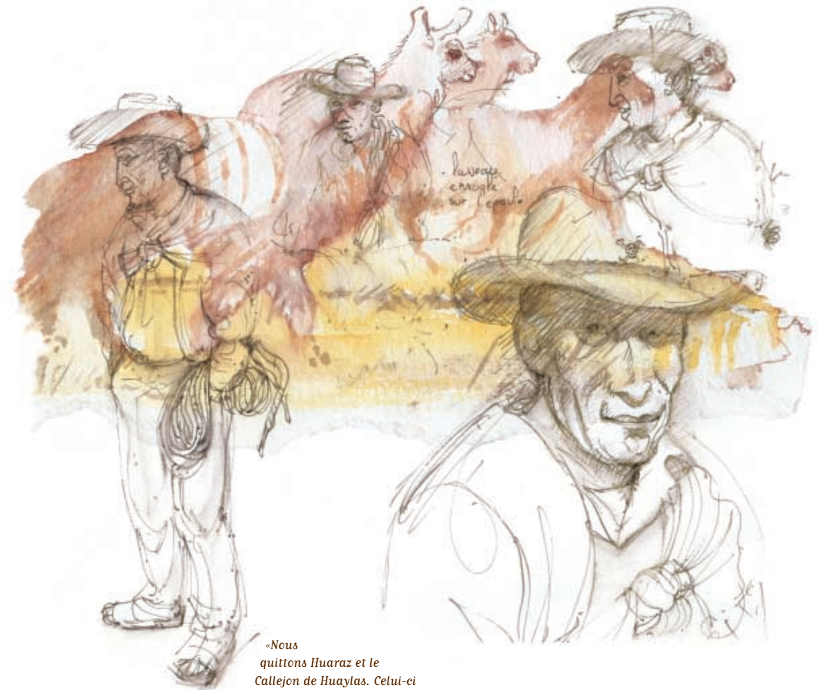
« Nous quittons Huaraz et le Callejón de Huaylas. Celui-ci s'achève par le canyon del Pato