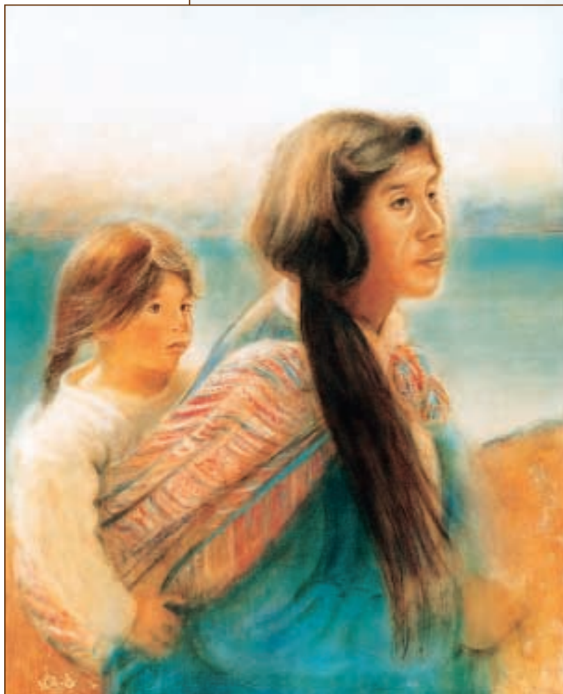
"Mère et enfant Quechua" Acrylique et huile sur toile 82 x 100 cm

Cette plaquette a été réalisée avec la collaboration de José Bure, photographeur et webmaster et Elisabeth Fally, maquettiste qui participent de façon active au projet Viva el Perú . Patrice Lecoq, maître de conférence en archéologie américaine à l'université de Paris I est l'auteur de la préface. Il s'occupe du suivi scientifique du livre. Fanny Moutarde est correspondante au Pérou où elle entreprend actuellement une thèse universitaire en archéologie. Alain Rosenbach, peintre, est l'auteur des autres textes et de l'ensemble du matériel visuel de l'ouvrage. Consultation et courrier internet sur http://www.vivaelperu.com