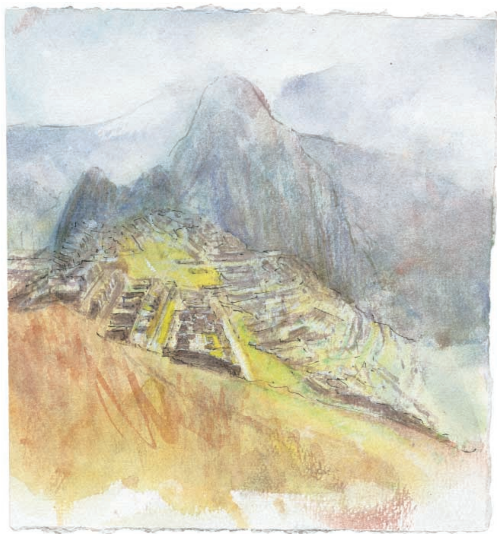
Le Machu Picchu dans son éternelle enveloppe de brume et de mystère.