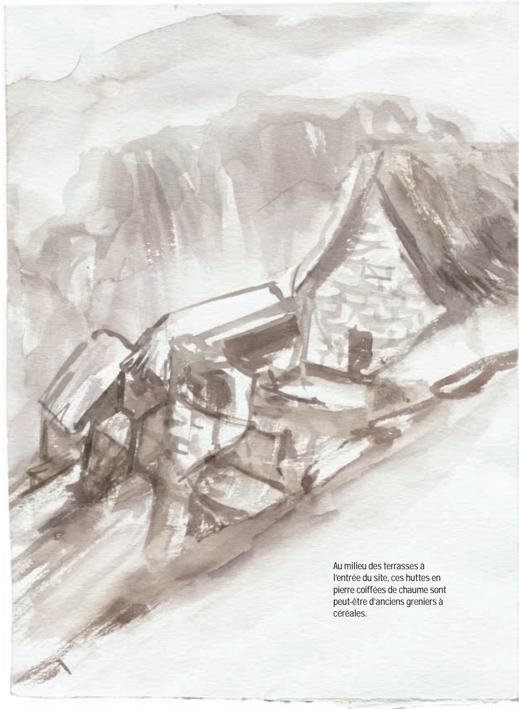
Au milieu des terrasses à l'entrée du site, ces huttes en pierre coiffées de chaume sont peut-être d'anciens greniers à céréales.