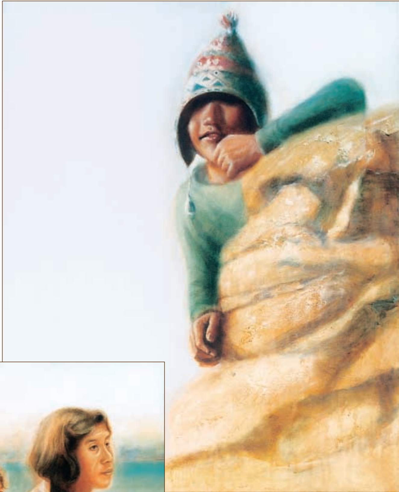
"Le guetteur" Acrylique et huile sur toile 82 x 100 cm