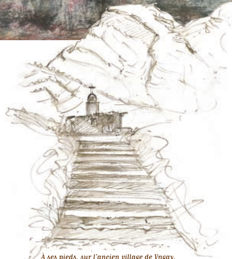
À ses pieds, sur l'ancien village de Yngay, une chapelle a été dressée.

La plus grande catastrophe glaciaire de l'histoire commençait. À 500 kilomètres/heure, des millions de tonnes de glace et de roche dévalèrent les pentes, détruisant tout sur leur passage, entraînant dans leur folle course des blocs pesant des centaines de tonnes jusqu'à quinze kilomètres du sommet. Yngay et ses vingt mille habitants furent rayés de la carte, la vallée ravagée ; soixante dix mille personnes périrent en trois minutes. L'impressionnante coulée de terre et d'alluvions est encore visible au pied du Huascarán.